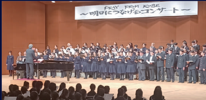
PFK公募合唱団・宮城県連有志合唱団 合同演奏 他