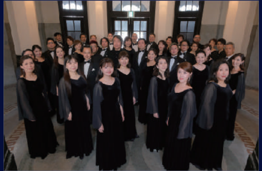
神戸市混声合唱団